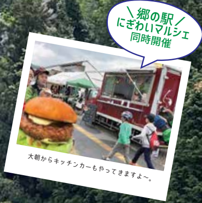
郷の駅！ にぎわいマルシェ 同時開催