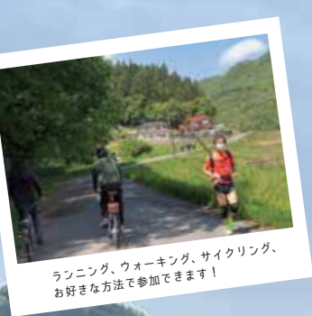
ランニング、ウォーキング、サイクリング、 お好きな方法で参加できます！