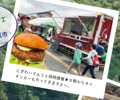
にぎわいマルシェ同時開催★大朝からキッチンカーもやってきますよ～