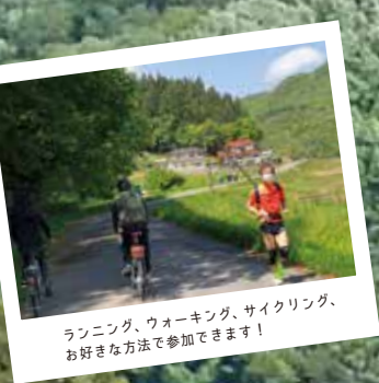
ランニング、ウォーキング、サイクリング、 お好きな方法で参加できます！